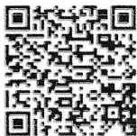
ГРАФИК ПЛАТЕЖЕЙ* к договору (контракту) от 14.09.2022 г. № 324-2-35-ХТ/2022

между "Голд Мега Капитал Строй Сервис " МЧЖ и Жондор туман ХТБ на общую сумму 756768980,00