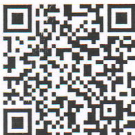
ГРАФИК ПЛАТЕЖЕЙ* к договору (контракту) от 23.09.2022 г. № 149294

между "IBRONIM STORY STAR" MCHJ и Жанубий Мирзачул магистрал канали бошкармаси на общую сумму 1035000000,00