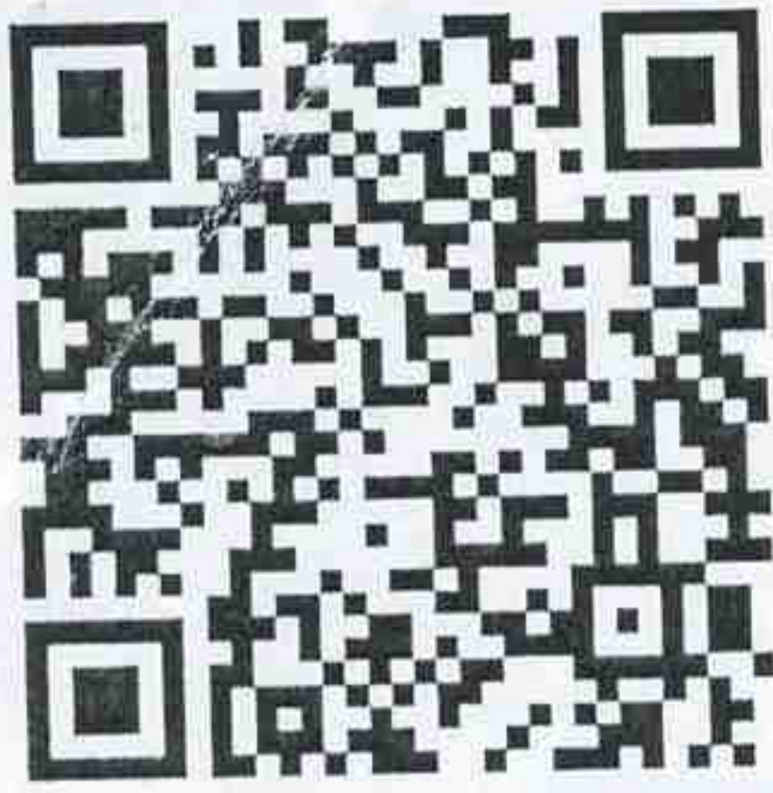
ГРАФИК ПЛАТЕЖЕЙ* к договору (контракту) от 19.09.2022 г. № 15

между "EFENDI-MEBEL" Xususiy korxonasi va Urush va mehnat faxriylari Tovuksoidi sihatgoxi na obshchuyu summu 115200000,00