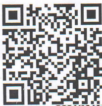
ГРАФИК ПЛАТЕЖЕЙ* к договору (контракту) от 08.09.2022 г. № 6

между HUSNIDDIN LAGISTIKA SERVIS MCHJ и Сирдарё туман Санитария-эпидемиологик осойишталик ва жамоат саломатлиги бўлими на общую сумму 11900000,00