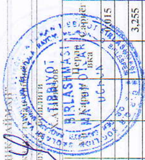
Э.Л.БЕКНЫ ТУМАН ТИВБИЕТ БИРЛИШИ Т.Т.Б. БУЛИМИ БЕСМОРЛАРИ УЧУН ТАОМНОМА 22-АВГУСТ 2022ЙИЛ