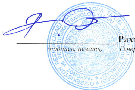
Рахматиллаев О.З. (подпись, печать) Генеральный директор

Р/С 2020 8000 5050 3234 5001 В Мирабадском ф-ле ЧАКБ "ОРИЕНТ ФИНАНС" МФО 01167 ИНН 306214930