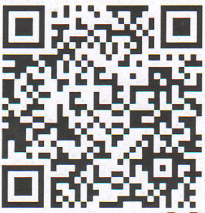
ГРАФИК ПЛАТЕЖЕЙ* к договору (контракту) от 05.01.2022 г. № 31

между ООО O'zbekiston Dori- Ta'minoti и Республика суд тиббий экспертиза илмий-амалий марказ Тошкент шаҳар филиали на общую сумму 3799600,00