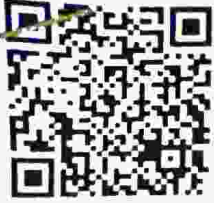
ГРАФИК ПЛАТЕЖЕЙ* к договору (контракту) от 11.01.2022 г. № 41120321

между O'ZBEKTELEKOM и Сирдарё вилояти юрак касалликлари диспансери на общую сумму 1350000,00