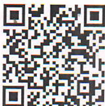
ГРАФИК ПЛАТЕЖЕЙ* к договору (контракту) от 11.01.2022 г. № 4

между ООО "ALLAYAR DAWLET" и 10-сонли кузи ожиз ва зайф курувчи болалар учун ихтисослаштирилган давлат мактаб-интернати на общую сумму 35750000,00