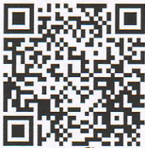
ГРАФИК ПЛАТЕЖЕЙ* к договору (контракту) от 11.01.2022 г. № 1

между Сирдарё вилоят Ҳокимлиги Бинолардан фойдаланиш бошқармаси и Сирдарё вилоят Ҳокимлиги на общую сумму 36954700,00