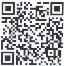
ГРАФИК ПЛАТЕЖЕЙ* к договору (контракту) от 13.01.2022 г. № 9

между ООО MEDIAPHARM и Тошкент вилояти фтизатрия ва пулманология маркази на общую сумму 975000,00