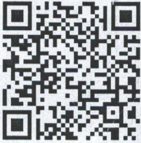
ГРАФИК ПЛАТЕЖЕЙ* к договору (контракту) от 13.01.2022 г. № 351054

между O'ZBEKTELEKOM и Куйи-Чирчик Ветотдел на общую сумму 71868,00