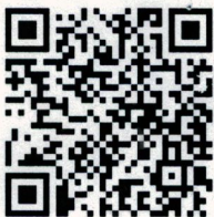
ГРАФИК ПЛАТЕЖЕЙ* к договору (контракту) от 12.01.2022 г. № 1024

между "LDH MEDICAL GMBH" MChJ и Республика шошилнч тиббий ёрдам илмий маркази Тошкент вилоят филиали на общую сумму 131700000,00