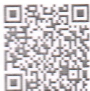
ГРАФИК ПЛАТЕЖЕЙ* к договору (контракту) от 08.01.2022 г. № 27-22-01

между ООО "PAVLON PETROL" и Узбекистон Республикаси Узбекчорванасл агентлиги Тошкент вилояти чорванасл маркази на общую сумму 5544000,00