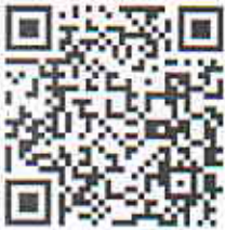
ГРАФИК ПЛАТЕЖЕЙ* к договору (контракту) от 05.01.2022 г. № 24

между ЯНГИ-МЕТАН-ГАЗ МЧЖ и Ховос туман Хоқимлиги на общую сумму 1200000,00