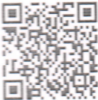
ГРАФИК ПЛАТЕЖЕЙ* к договору (контракту) от 10.01.2022 г. № 1907541362

между O'ZBEKTELEKOM и Узбекистон Республикаси Узбекчорванасл агентлиги Тошкент вилояти чорванасл маркази на общую сумму 810000,00