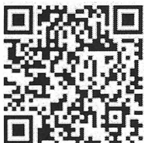
ГРАФИК ПЛАТЕЖЕЙ* к договору (контракту) от 17.01.2022 г. № 4

между Узагросургурта и Чорбог сув омбори бошкармаси на общую сумму 940800,00