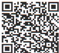
ГРАФИК ПЛАТЕЖЕЙ* к договору (контракту) от 17.01.2022 г. № 25

между "Тахиаташ нефт базаси" МЧЖ и Каракалпакистон Республикаси Гидрометеорология хизмати маркази (ККГидромет) на общую сумму 6654220,33 сум