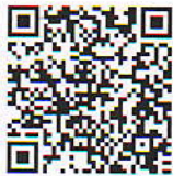
ГРАФИК ПЛАТЕЖЕЙ* к договору (контракту) от 17.01.2022 г. № 017446024

между Янгиарик туман электр тармоклари корхонаси и Янгиарик туман ХТБ (Марказлашган) на общую сумму 116582400,00