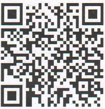
ГРАФИК ПЛАТЕЖЕЙ* к договору (контракту) от 05.01.2022 г. № 1910011

между Янги Хаёт Махсустрас и Республика суд тиббий экспертиза илмий-амалий марказ Тошкент шаҳар филиали на общую сумму 599736,66