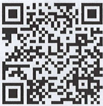
ГРАФИК ПЛАТЕЖЕЙ* к договору (контракту) от 08.01.2022 г. № 31

между Гулистон Нефтбаза МЧЖ и Ўзбекистон Республикаси Президент хузуридаги Давлат хизматини ривожлантириш агентлиги на общую сумму 7861670,19