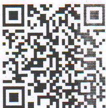
ГРАФИК ПЛАТЕЖЕЙ* к договору (контракту) от 14.01.2022 г. № 246

между Бухоро вилоят "Сувокова" ДУК и Когон шаҳар Бандликка кумаклашиш маркази на общую сумму 224933,80