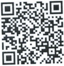
ГРАФИК ПЛАТЕЖЕЙ* к договору (контракту) от 14.01.2022 г. № А-35

между ООО "ASIA PHARM LYUKS" и Ташкент тумани Тиббиёт бирлашмаси на общую сумму 1233960,00