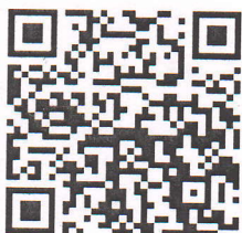
ГРАФИК ПЛАТЕЖЕЙ* к договору (контракту) от 12-Январь 2022 г № 150

между ООО "INSEP" и Республикалик шошолинч тиббий ердэм илимий маркази КК филиал на общую сумму 24729500