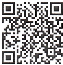
ГРАФИК ПЛАТЕЖЕЙ* к договору (контракту) от 17.01.2022. № 58

между Бустонлик туман ф-ли Тошкент сув таъминоти МЧЖ Бустонлик тумани 2-сон касб-хунар мактаби на общую сумму 999 996,90