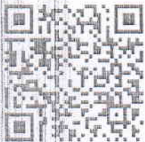
ГРАФИК ПЛАТЕЖЕЙ* к договору (контракту) от 17.01.2022 г. № 26/1

между Жондор Электр тармоклари и Жондор туман Ободонлаштириш бошкармаси на общую сумму 599400,00