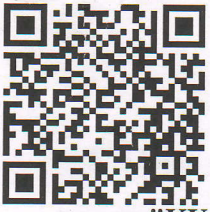
ГРАФИК ПЛАТЕЖЕЙ* к договору (контракту) от 08.01.2022 г. № 4/2

между "KUCHLIK NEFT VAZA" MCHJ и Бекобод шаҳар Ободонлаштириш булими на общую сумму 14172000,00