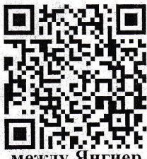
ГРАФИК ПЛАТЕЖЕЙ* к договору (контракту) от 05.01.2022 г. № 0040

между Янгиер шаҳар Электр тармоқлари корхонаси и Янгиер шаҳар хайвонлари касалликлари таъхиси ва озик-овқат мансулотлари хавсизлиги давлат маркази на общую сумму 900000,00