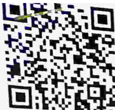
ГРАФИК ПЛАТЕЖЕЙ* к договору (контракту) от 14.01.2022 г. № 7-CVS

между ООО CVS-MEDICAL и Сирдарё вилояти юрак касалликлари диспансери на общую сумму 15970000,00