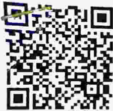
ГРАФИК ПЛАТЕЖЕЙ* к договору (контракту) от 13.01.2022 г. № 3/15

между ООО "ASIA PHARM LYUKS" и Сирдарё вилояти юрак касалликлари диспансери на общую сумму 4910000,00