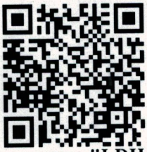
ГРАФИК ПЛАТЕЖЕЙ* к договору (контракту) от 17.01.2022 г. № 1073

между "LDH MEDICAL GMBH" MChJ и Республика шошинч тиббий ёрдям илмий маркази Тошкент вилоят филиали на общую сумму 47940000,00