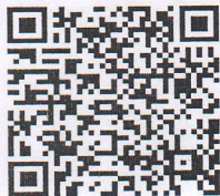
ГРАФИК ПЛАТЕЖЕЙ* к договору (контракту) №101316 от 18.01.2022 г.

между "QARAQALPAQ SUV TAMINOTI" MCHJ и Каракалпак Гос театр кукол на общую сумму 1 994 940,09