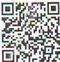
ГРАФИК ПЛАТЕЖЕЙ* к договору (контракту) от 05.01.2022 г. № 6

между "HUDUDGAZTA'MINOT" AJ и Бухоро туман ХТБ на общую сумму 10000000,00