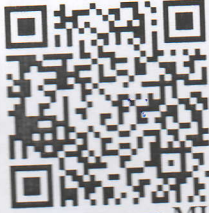
ГРАФИК ПЛАТЕЖЕЙ* к договору (контракту) от 18.01.2022 г. № 1/5

между МЧЖ "TEMUR SARBON" машина трактор парк и Паркент тумани БКМ на общую сумму 1649200,00