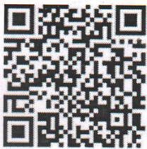
ГРАФИК ПЛАТЕЖЕЙ* к договору (контракту) от 17.01.2022 г. № 40509951

между О'ЗВЕКТЕЛЕКОМ и Ихтисослаштирилган санъат мактаб-интернати на общую сумму 2100000,00