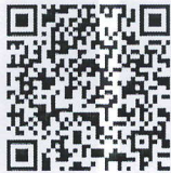
ГРАФИК ПЛАТЕЖЕЙ* к договору (контракту) от 12.01.2022 г. № 08-20727/1980

между O'ZBEKTELEKOM и Боявут туман хокимлиги на общую сумму 4500000,00