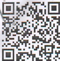
ГРАФИК ПЛАТЕЖЕЙ* к договору (контракту) от 05.01.2022 г. № 10

между Бухоро вилоят "Сувокова" ДУК и Бухоро туман ХТБ на общую сумму 500000,00