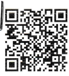
ГРАФИК ПЛАТЕЖЕЙ* к договору (контракту) от 05.01.2022 г. № 1

между ООО Узжунимпекс и Бухоро шаҳар МТБ на общую сумму 20552000,00