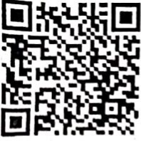
ГРАФИК ПЛАТЕЖЕЙ* к договору (контракту) от 19.01.2022 г. № 1483

между Toshkent viloyati "Toza hudud" DUK и Оккургон тумани МТБ на общую сумму 14994275,00