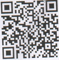
ГРАФИК ПЛАТЕЖЕЙ* к договору (контракту) от 05.01.2022 г. № 020234.

между "HUDUDGAZTA'MINOT" AJ и Когон шахар Хокимлиги на общую сумму 5499978,00