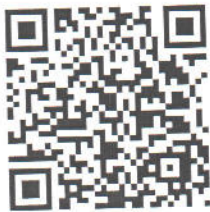
ГРАФИК ПЛАТЕЖЕЙ* к договору (контракту) от 18.01.2022 г. № 01

между "Ўзбекистон почтаси" АЖ и Сирдарё в. Мусикали Драма театри на общую сумму 1392402,00