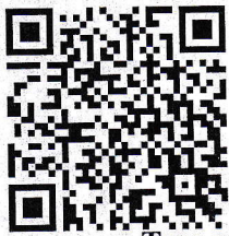
ГРАФИК ПЛАТЕЖЕЙ* к договору (контракту) от 06.01.2022 г. № 0004051

между Тоза худуд ДУК и Янгйер шаҳар хайвонлари касалликлари таххиси ва озик-овқат мансулотлари хавсизлиги давлат маркази на общую сумму 294975,00