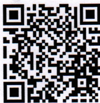
ГРАФИК ПЛАТЕЖЕЙ* к договору (контракту) от 18.01.2022 г. № 160

между "Охрана" упр.охр.при УВД Таш. обл. и Угом Чоткол Давлат миллий табиат боги бошкармаси на общую сумму 66157710,00