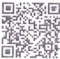
ГРАФИК ПЛАТЕЖЕЙ* к договору (контракту) от 10.01.2022 г. № 13

между ООО "ANGREN NEFT BIZNES" и Ангрэн шахар Хокимлиги Молния будими на общую сумму 1500000,00