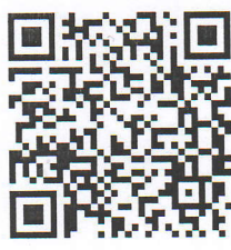
ГРАФИК ПЛАТЕЖЕЙ* к договору (контракту) от 12.01.2022 г. № 2150

между O'ZBEKTELEKOM и Ислом Каримов номидаги ТДТУ академик лицейи на общую сумму 100000,00