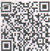
ГРАФИК ПЛАТЕЖЕЙ* к договору (контракту) от 20.01.2022 г. № 40245186

между O'ZBEKTELEKOM и Маданият булими на общую сумму 720000,00