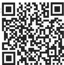
ГРАФИК ПЛАТЕЖЕЙ* к договору (контракту) от 19.01.2022 г. № 45-22.М

между МЧЖ "ISKANDAR MAFTUNA BUSINESS" и Тошкент вилоят Согликни сақлаш бошқармасига қарашли Махсус тиббий база на общую сумму 3510000,00