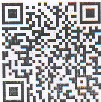
ГРАФИК ПЛАТЕЖЕЙ* к договору (контракту) от 19.01.2022 г. № 0003708

между Тоза худуд ДУК и Сирдарё туман Санитария-эпидемиологик осойишталик маркази на общую сумму 599265,00