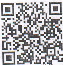
ГРАФИК ПЛАТЕЖЕЙ* к договору (контракту) от 19.01.2022 г. № 31

между "Сирдарё сув таминоти" МЧЖ Сирдарё т филиали и Сирдарё туман Санитария-эпидемиологик осойишталик маркази на общую сумму 449280,00