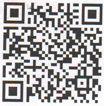
ГРАФИК ПЛАТЕЖЕЙ* к договору (контракту) от 14.01.2022 г. № 55/8-3

между Кизилтепа туман эл тармоклари и Қизилтепа туман ХТБ на общую сумму 945000,00